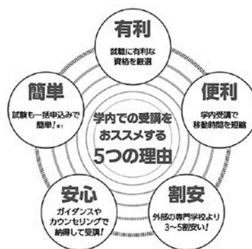
JU キャリアラウンジ 5つのメリット