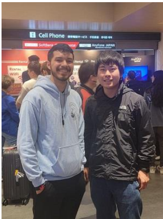
友人と日本に帰国

最後に、これまで私の留学を支援してくださったみなさんにはとても感謝しています。当初は英語力の向上だけを考えていましたが、それ以上に大切な出会いがたくさんありました。留学を終え、日本に帰ってからはとても大きな喪失感を味わっていますが、日本でもより多くの友人を作り、世の中を明るく照らせるようになりたいです。