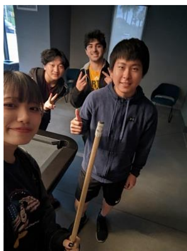
ビリヤードで勝負!!