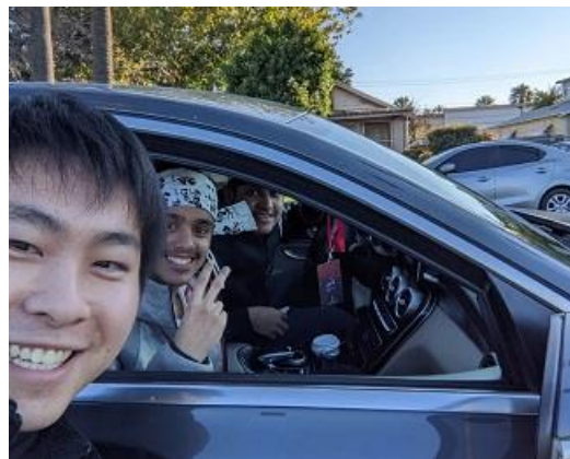
良い出会いと別れ

秋のクォーターが終わり、友人との別れもありましたが、友人が与えてくれた影響のおかげで、冬のクォーターでたくさんの友人ができました。毎日出掛けたり、遊ぶ予定があったりと、留学が終わるまでの日々はあっという間でした。