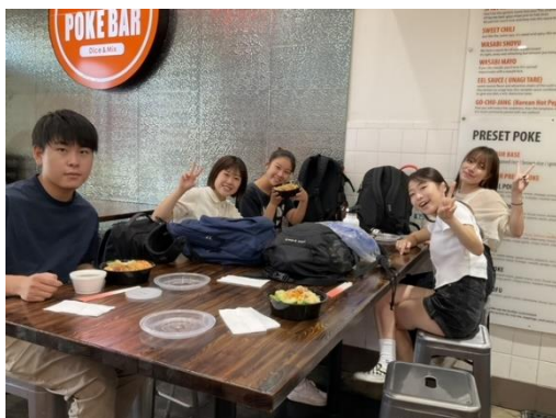
留学初期・城西国際大学の生徒とランチ

留学をして初めの1ヶ月間はとても大変でした。海外での生活に慣れていなかったのもそうですが、ホストファミリーや先生などの英語が全く聞き取れなかったからです。英語を聞き取れないと話すこともできないので、私は人との出会いを避けるように、一人で淡々と英語の勉強をしていました。また、最初の400クラスの授業ではクラスメイトとの交流も上手く行かず、さらには先生からクラスを下げることで提案されてしまいました。自分のspeakingとwriting力を考え、渋々クラスを300に下げましたが、そこには思いもよらない出会いがありました。