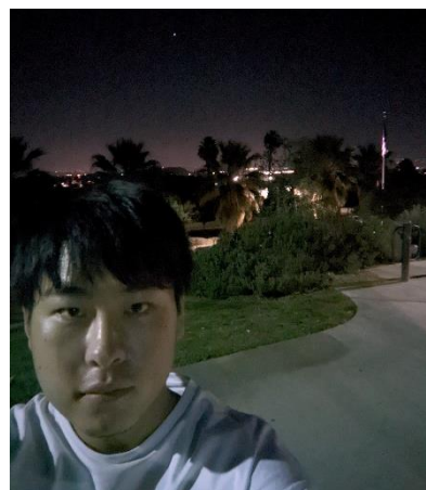
留学初期・初めは不安から