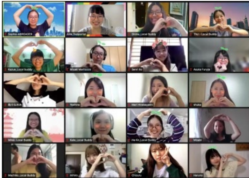
友情のハートマーク

1つ目の理由は国際交流に興味があったからです。私は 2018 年度に新設されたグローバルチャレンジ奨学生に採用されたこともあり、在学中は国際交流に力を入れました。しかし COVID-19 の世界的な流行により海外渡航が困難になりました。ステイホームしながら国際交流できる方法を探し、このセミナーの開催を知りました。